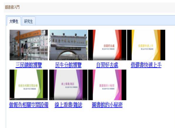
利用教育宣導影片